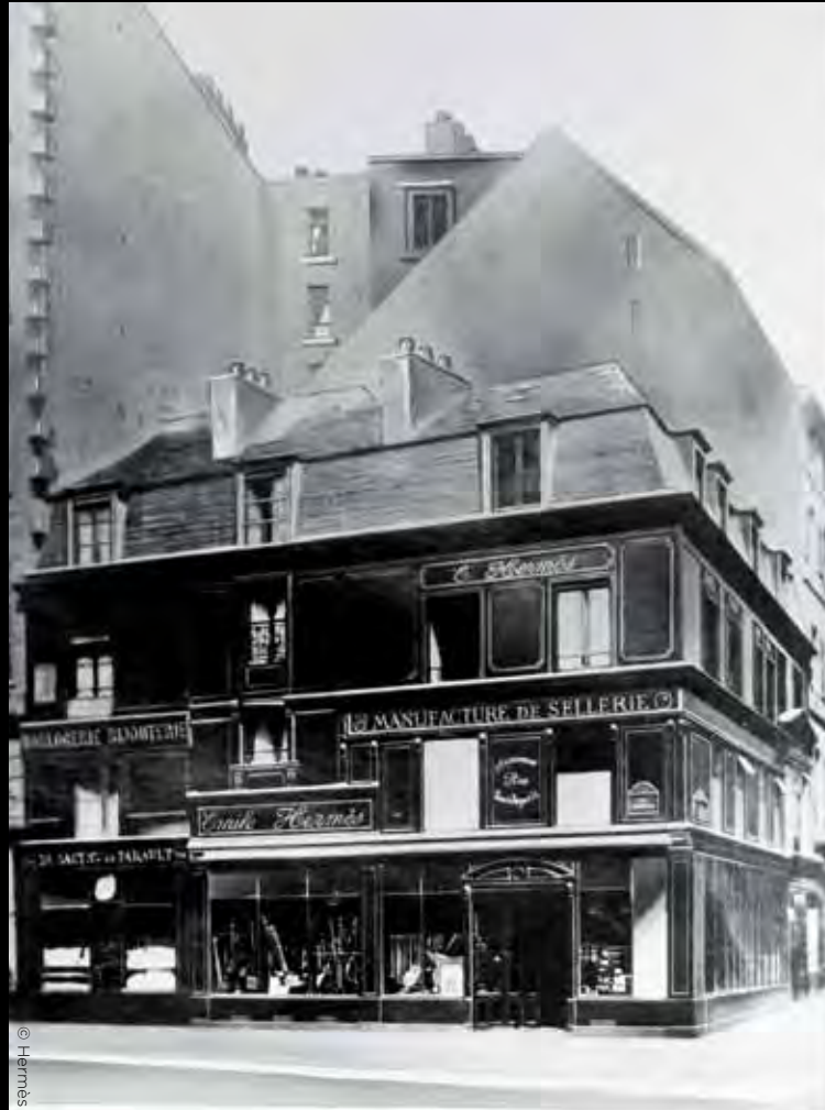
1880 年遷至 24 Rue du Faubourg Saint-Honoré，Hermès 的總部至今仍在這裡。

與 Apple 合作，推出 Hermès 專屬皮帶的 Apple Watch Hermès。