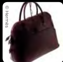
Bolide 包，第一款將拉鍊首度運用在皮革上的皮包。