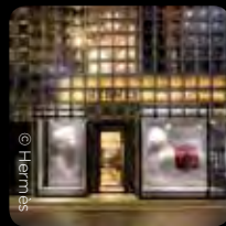
東京銀座愛馬仕之家