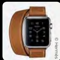
Apple Watch Hermès