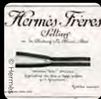
拉鍊專利 Catalogue Hermès