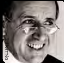
Jean-Louis Dumas Hermès