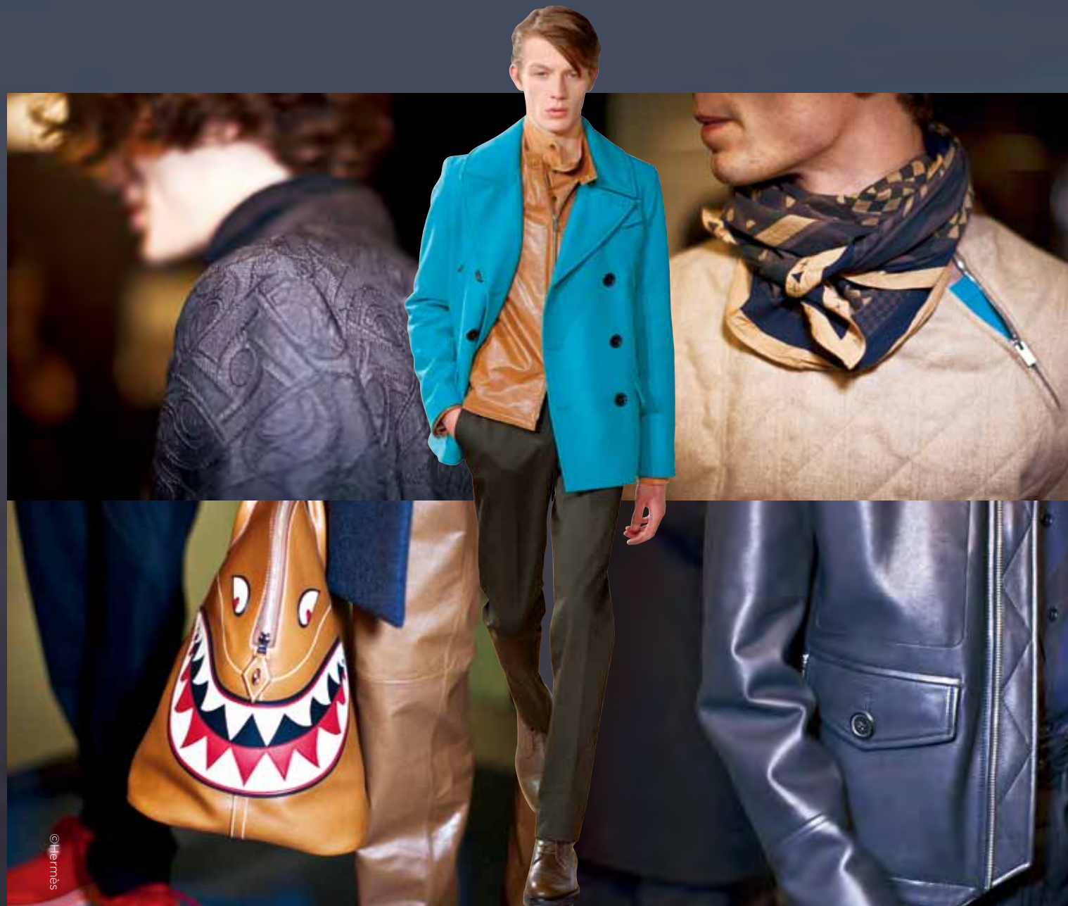
2016 秋冬男裝用色細節，傳遞在內外穿搭巧思的層次之中，而不斷精進的皮革技術，在追求輕量質地之外，也以拼貼手法，獻上皮件設計的趣味幽默。